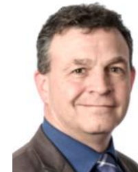
Christian Berset Assurances de dommages