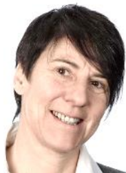
Noëly Sottaz Assurances de personnes